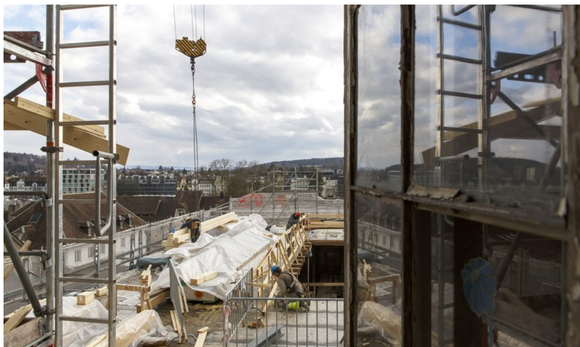
Hier kommt noch das neue Dachgeschoss des Leist-Flügels hin.

Im Frühling 2017 möchte die Genossenschaft Baseltor als Betreiber das neue Restaurant und Hotel Krone in Solothurn wieder eröffnen. Vorher gibts allerdings noch sehr viel zu tun.